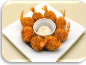
まんまるエビフライ